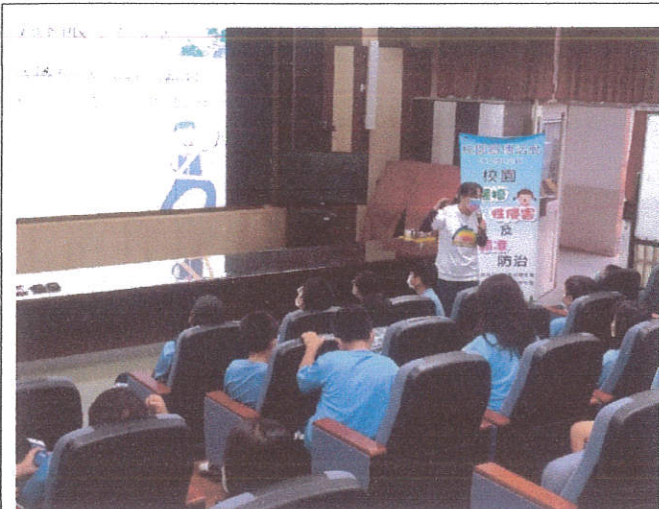
文字說明:性別平等教育宣導講座 -校園性騷擾、性侵害及性霸凌防治