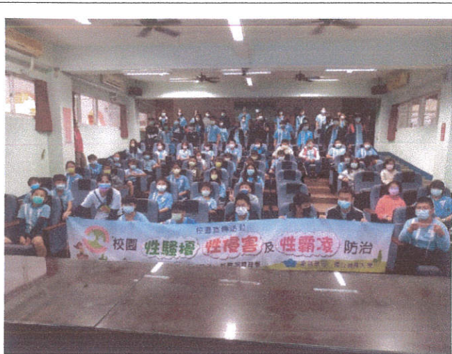
文字說明:性別平等教育宣導講座 -校園性騷擾、性侵害及性霸凌防治