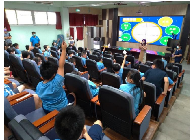
文字說明:性別平等教育宣導講座 -性剝削防治宣導