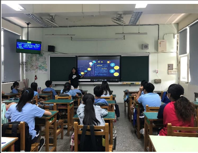
文字說明:校園影片宣導