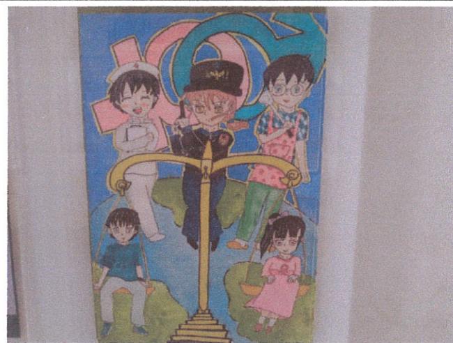
文字說明:性別平等徵圖比賽