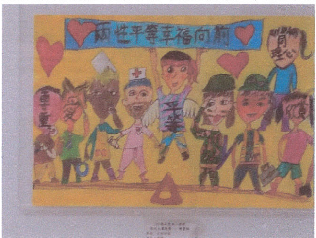
文字說明:性別平等徵圖比賽