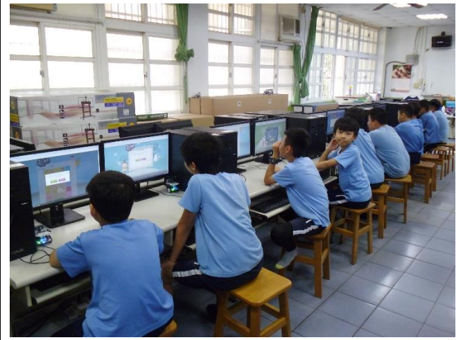
文字說明:資訊課融入性別平等教育宣導