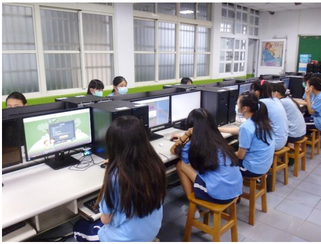
文字說明:資訊課融入性別平等教育宣導