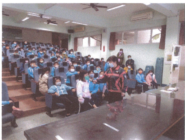
文字說明:性別平等教育宣導講座