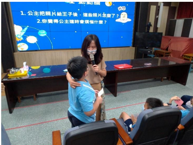
文字說明:性別平等教育宣導講座 -性剝削防治宣導