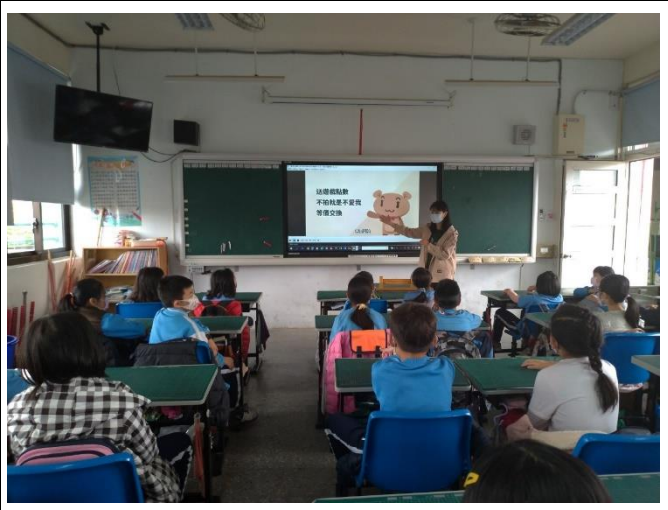
文字說明:校園影片宣導